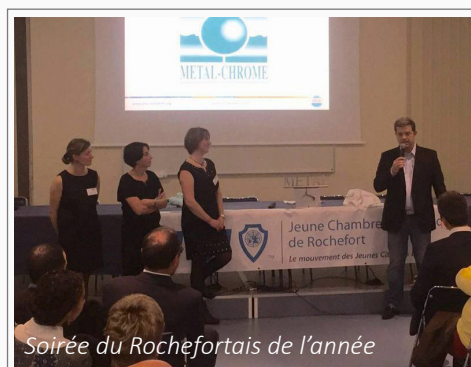
Soirée du Rochefortais de l'année